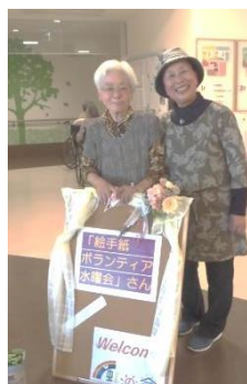
絵手紙水曜会 の皆さん